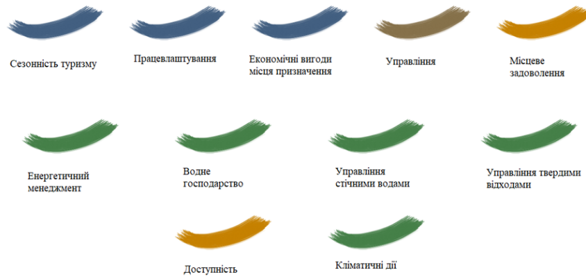
Рисунок 2.4 – Основні проблемні сфери, за якими повинні стежити обсерваторії сталого розвитку туризму