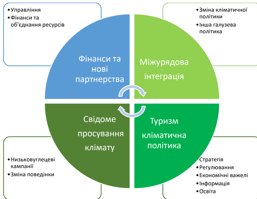
Рисунок 2.1 - Основні сфери кліматичних дій, доступні для національних туристичних адміністрацій