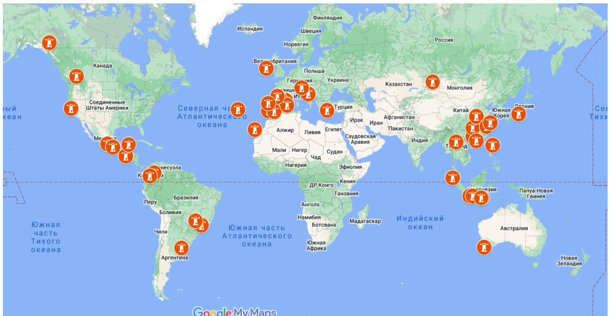
Рисунок 2.3 – Міжнародна мережа обсерваторій сталого розвитку туризму Сформовано автором на основі Джерела: [48].

Іспанії, дві в Канаді, дві в Колумбії, три в Мексиці, одна на Філіппінах, одна в Японії і одна в Ірландії. (рис.2.3).