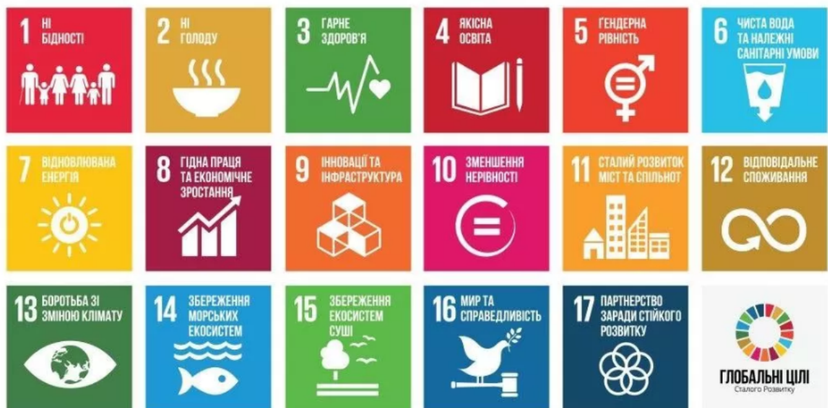
Рисунок 1.1 – Глобальні цілі сталого розвитку суспільства

затвердила новий план дій «Перетворення нашого світу: Порядок денний сталого розвитку до 2030 року». У резолюції підкреслюється, що світові лідери ніколи не зобов'язувалися спільно діяти та докладати зусиль для реалізації такого широкого та універсального стратегічного плану. Учасники підкреслили своє прагнення реалізувати Порядок денний у спосіб, який принесе найбільшу вигоду всім – нинішнім і майбутнім поколінням – на основі поваги до принципів прав і зобов'язань держав за міжнародним правом. 17 цілей і 169 завдань нового плану заходів реалізовано 1 січня 2016 року. План дій розрахований на 15 років – до 2030 року [1]. На рис. 1.1 наведено глобальні цілі сталого розвитку суспільства.