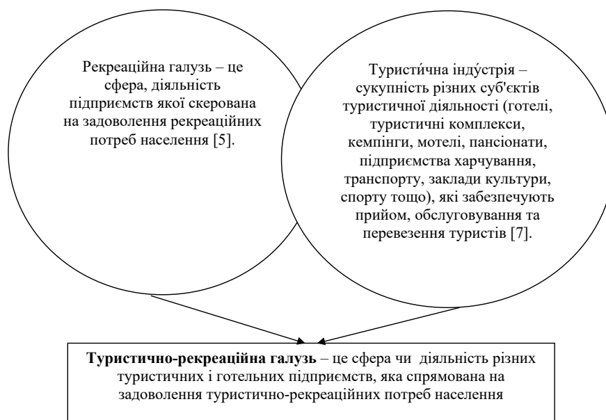
Рис. 1. Схема визначення поняття «туристично-рекреаційна галузь» в сучасних умовах

Вивчаючи низку наукових літературних джерел хочемо запропонувати схему формування поняття туристично-рекреаційної галузі (рис. 1).