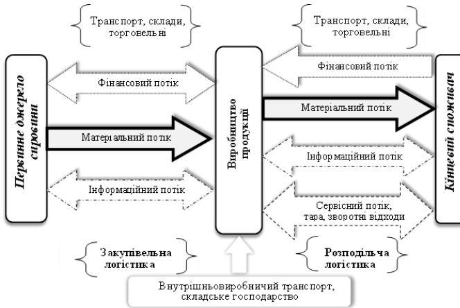
Рис 1. Структурно-функціональні взаємозв'язки у логістичній системі

Так, базовими елементами логістичної системи є логістичні об'єкти (транспорт, склади), суб'єкти логістичної діяльності (закупівельники, представники розподільчих мереж, організатори фінансового, інформаційного, сервісного обслуговування), логістичні потоки (матеріальні, інформаційні, фінансові, сервісні) (рис.1).