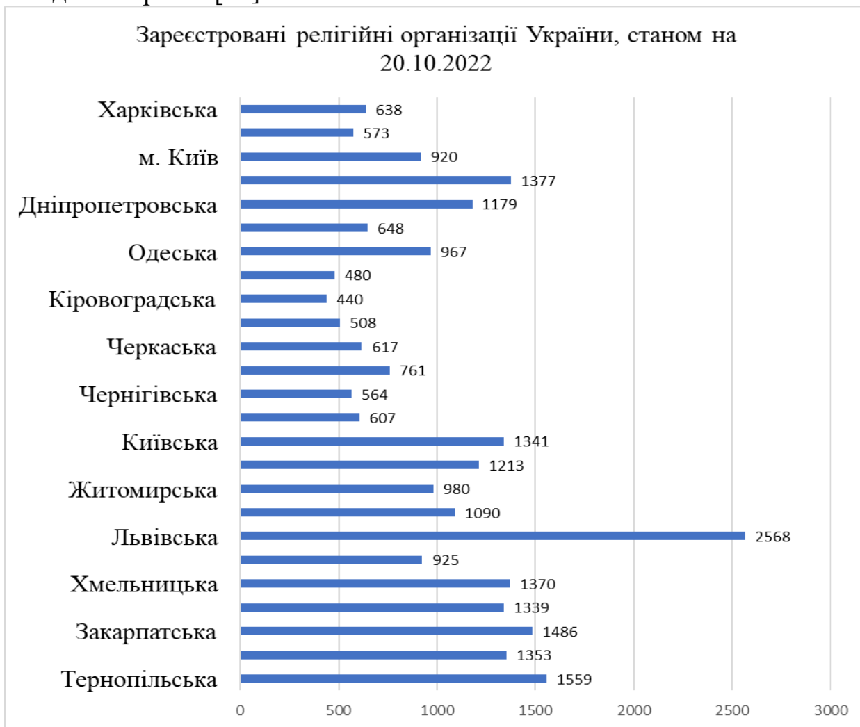
Рис. 7.6. Релігійні організації України.*

Львівської архієпархії вирізняється кількістю прощ серед всіх центрів України та здійснює загальне керівництво паломництвом Західної України [21].