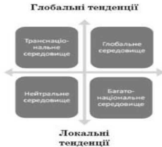
Рис. 2.2. Матриця аналізу зовнішнього середовища

Якщо зобразити зовнішнє середовище графічно в системі вимірів, де вертикальна вісь - глобальні тенденції, а горизонтальна - локальні, то отримаємо як мінімум чотири варіанти міжнародного середовища, кожен з яких має свої особливості і сприяє розвитку тих чи інших організаційних форм бізнесу: нейтральне, багатонаціональне, транснаціональне, глобальне (рис. 2.2).