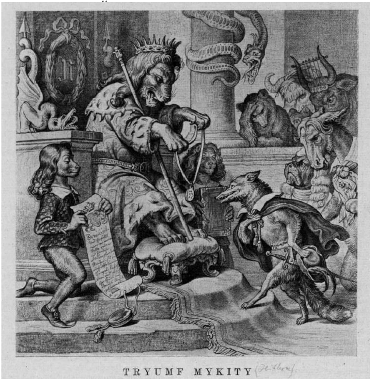
Ілюстрація «Тріумф Микити» Ogłoszenia//Łowiec – 1939. – № 1-2.

Ogłoszenia//Łowiec – 1934. – № 1. – S.12.