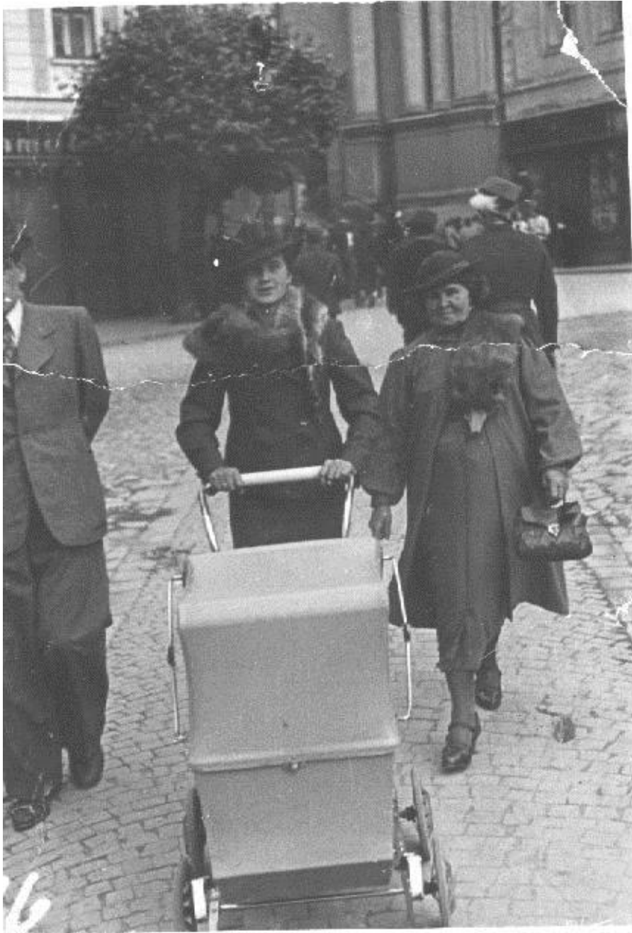
Галицькі модниці у строях з хутром лисиці, 1938 р.

Najwyższe ceny za skóry wszelakiego rodzaju, jakoto lisy, kuny, tchórze, skórki zajęcze, rożki sarnie i jelenie, płaci firma FALL, Wagowa 5, LWÓW.