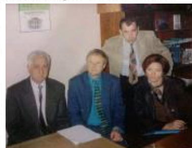
З британським колегою та іншими науковцями, гостями кафедри гігієни, нашого університету. Обговорюються питання добробуту тварин .