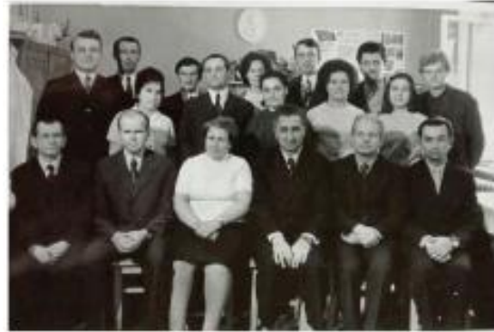
Кафедра гігієни тварин Львівського зооветеринарного інституту, 70-ті роки XX століття