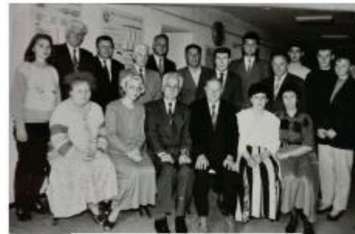
Міжнародні збори провідних зоогігієністів на кафедрі гігієни тварин Львівської державної академії ветеринарної медицини. Кінець 90-х років XX століття