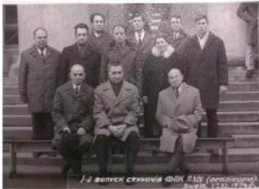
1-й випуск слухачів ФПК ЛЗВІ, Львів, 17.09.1974 р.