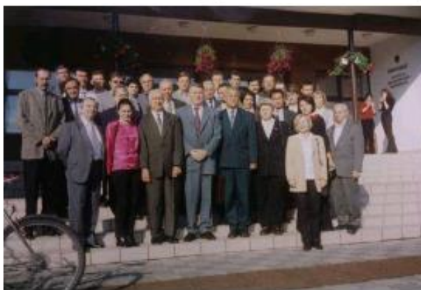
Учасники Міжнародної конференції у одному з польських аграрних вузів.